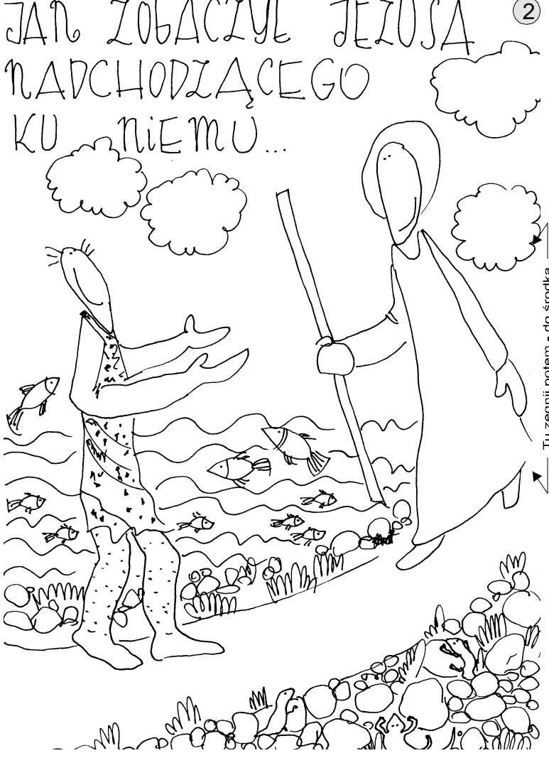
Ewangelia na niedzielę 19.01.2020r. J 1, 29-34

2 JAN ZOBACZYŁ JEZUSA NADCHODZĄCEGO KU NIEMU...