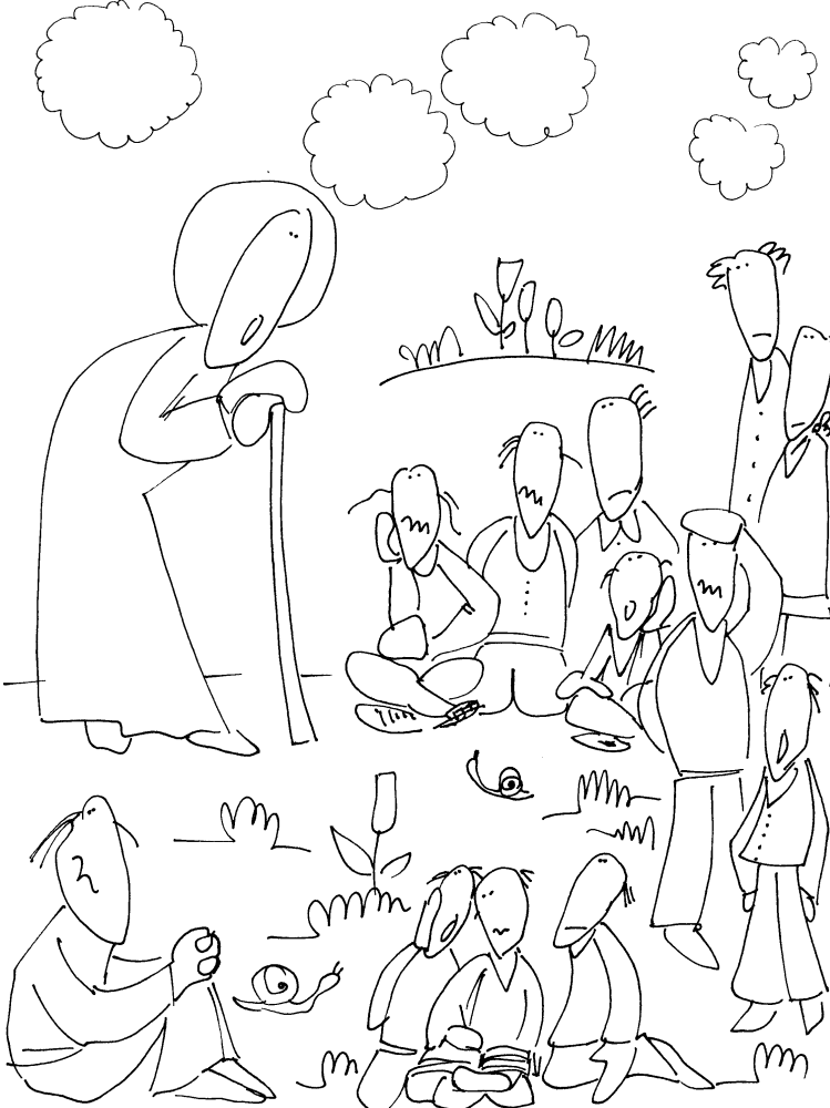
Ewangelia na niedzielę 01.12.2019r. Mt 24,37-44