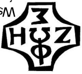
Światło - życie „On jest” Wspólnota Domowego Kościoła Ruchu

7) Słowo Boże w obrazkach dla dzieci dostępne również na stronie: www.onjest.pl/slowo